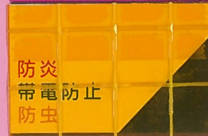
デルマ 350B 2