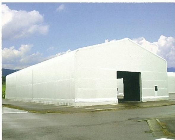
施工例：テント倉庫