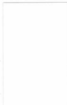
高透光ホワイト [透光率:10.0%]